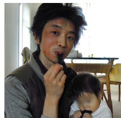
アトピーに悩んでいた時の弊社代表